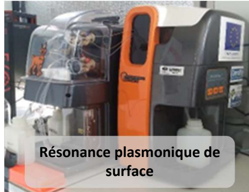
Résonance plasmonique de surface