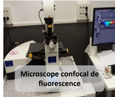
Microscope confocal de fluorescence