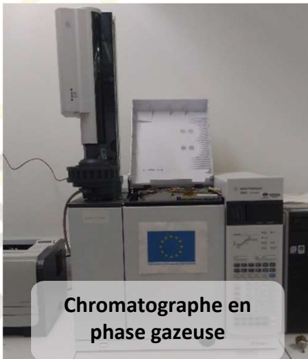
Chromatographe en phase gazeuse