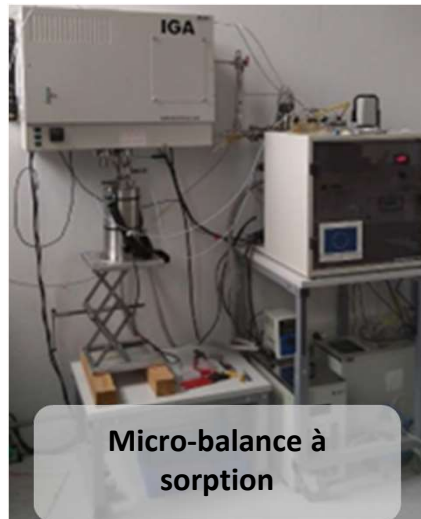
Micro-balance à sorption